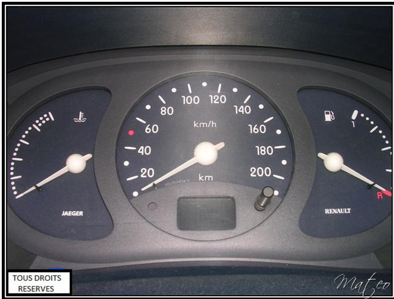
Génération 2 : Éclairage par leds, Fond noir ou blanc, Montage sur Clio 2.1 après Semaine 43 de 1999